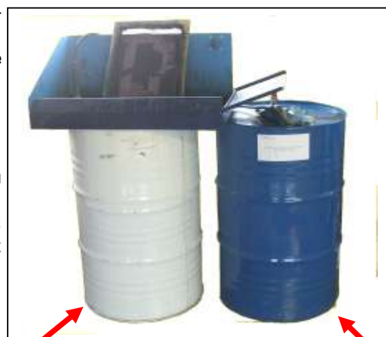
Fût de récupération du solvant usagé