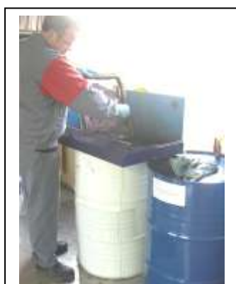
1. NETTOYAGE D'ÉCRAN DE SÉRIGRAPHIE en FONTAINE de LAVAGE