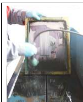
2. ASPERSION A LA BROSSE