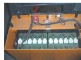
Accumulateurs de transpalette électrique