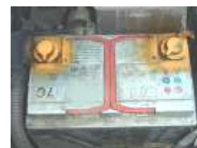
Batterie de véhicule léger