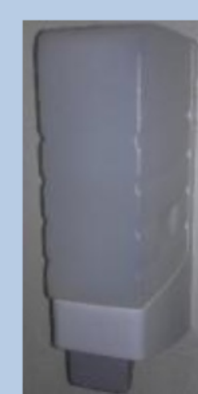
Cartouche plastique de 4 litres code C21 pour distributeur UX40