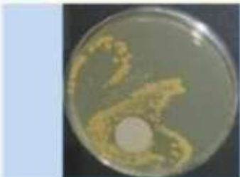
Surface sale initiale comportant des développements bactériens

RECHERCHE de l'INFLUENCE de l'association synergisée d'ENZYMES sur un biofilm provenant d'une contamination microbienne croisée associant bactéries et levures provenant de l'Institut Pasteur : BIOFILM renfermant PSEUDOMONAS AERUGINOSA aérobies strictes ( Gram - ) Pyocyanique pathogène contaminant hydrique, STAPHYLOCOCCUS AUREUS saprophyte aéroanaérobie ( Gram + ) pyogène et pathogène, ESCHERICHIA COLI entérobactéries ( Gram - ) responsables contaminations fécales, CANDIDA ALBICANS (Levures) responsables des candidoses pathogènes et de la fleur du vin.