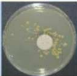
Surface après nettoyage avec un nettoyant sans enzymes : il reste de nombreuses colonies de microorganismes