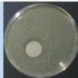
Surface après nettoyage avec le nettoyant enzymatique : réduction très significative du nombre de colonies de microorganismes